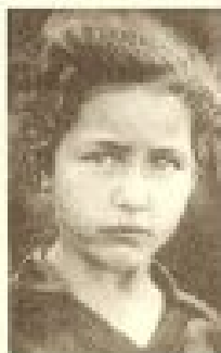
Foto di Sebastiao Salgado Bambina sem lama Paraná 1996

Per informazioni: Scuola Media Statale "A. Fogazzaro" Via Roma, 29 - 36070 Trissino (VI) Tel.: 0445.962055 - 0445.490506 - Fax: 0445.497330 e-mail: isttrissino@tiscali.it